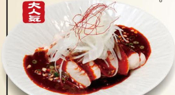
やみつき!よだれ鶏 780 Drooling chicken / 流口水鸡