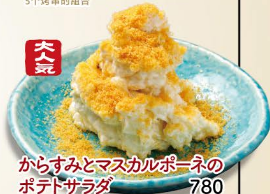
からすみとマスカルポーネの ポテトサラダ 780 大人気 Potato salad with Dried mullet and Mascarpone cheese / 土豆沙拉配干鲱鱼子和马斯卡彭奶酪

インスタでは 新作料理や 限定メニュー、 お得なイベント 情報など 随時配信中!