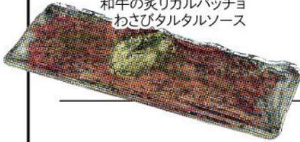
和牛の炙りカルパッチョ わさびタルタルソース

からすみとマスカルポーネのポテトサラダ 780 Potato salad with dried mullet and Mascarpone cheese / 土间沙拉配干鲱鱼子和马斯卡尔波纳