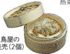
焼き鳥屋の鶏焼売(2個)