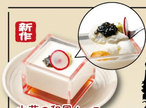
山芋の和風ムース キャビアとワサビを添えて Japanese-style Mountain Yam mousse with caviar and wasabi / 680 日式山药慕斯配鱼子酱和芥末