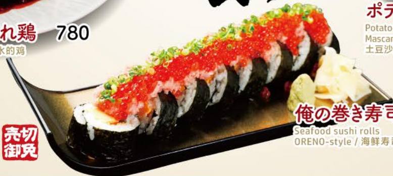
俺の巻き寿司 (4貫) 980 Seafood sushi rolls 4 pieces ORENO-style / 海鮮寿司卷 (8貫) 1,880 8 pieces

肉質にこだわり厳選した やきとりを毎日、一本一本仕込みます。 安いだけじゃない、 美味しさをつきつめます。