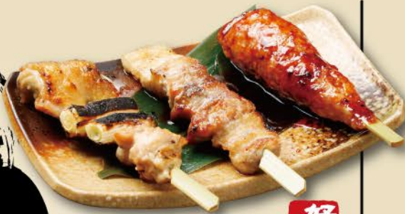
厳選3種串 1,280 好評 ・手ごね生つくね・山形豚のバラ串 ・赤鶏のねぎま串 Specially selected 3 kinds of skewers / 3种严选串烧组合