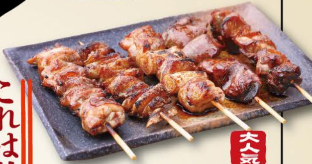
おまかせ串5本盛り 690 大人気 Assortment of 5 Omakase Skewers / 5个烤串的組合