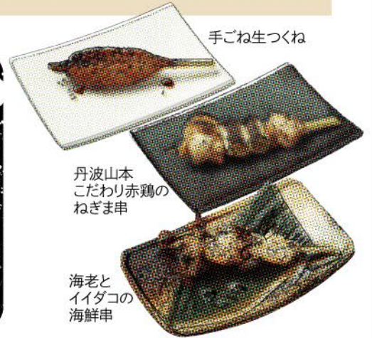
丹波山本 こだわりの赤鶏の ねぎま串