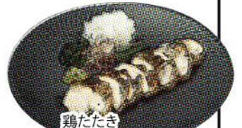
鶏たたき 刻み山葵と鬼おろし ~低温仕上げ~

Side dishes & Cold Appetizers / 开胃菜 & 凉菜