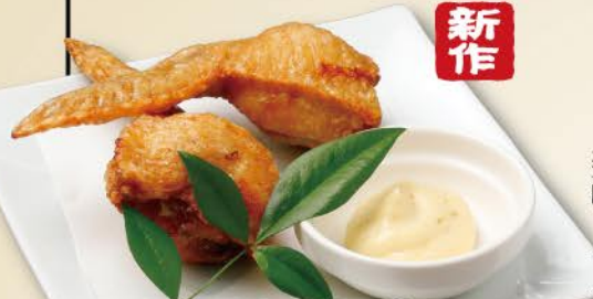
手羽先餃子揚げ 柚子胡椒マヨネーズ 680 Deep-fried chicken wing dumplings with Yuzu pepper mayonnaise / 炸鸡翅和饺子 柚子胡椒蛋黄酱