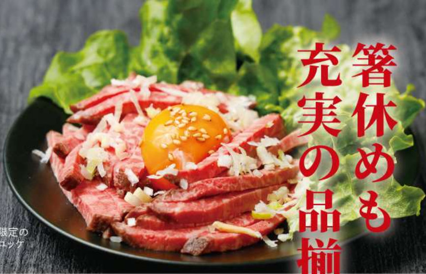
数量限定の 和牛ユッケ