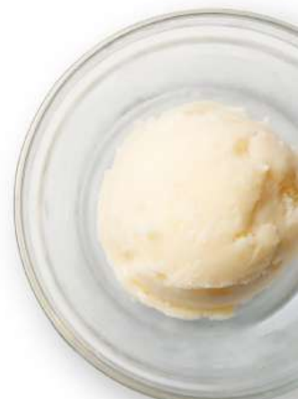
濃厚バニラアイス