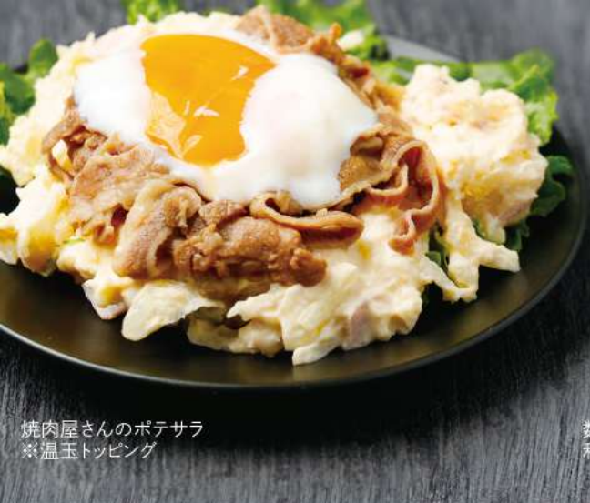
焼肉屋さんのポテサラ ※温玉トッピング