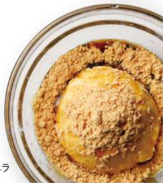
黒みつきなこバナナ