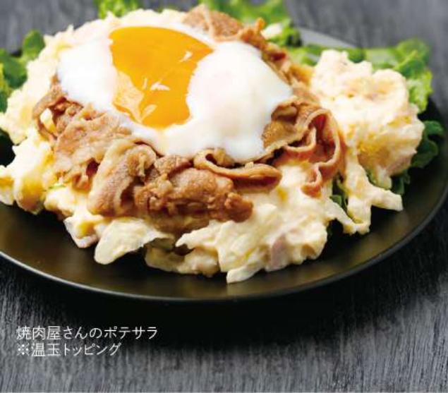
焼肉屋さんのポテサラ ※温玉トッピング