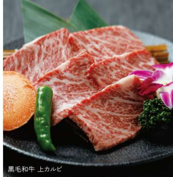
黒毛和牛 上カルビ