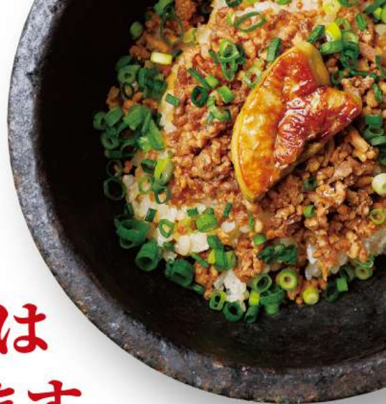
石焼フォアグラ・ビビンバ