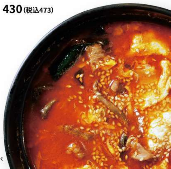
ユッケジャンクッパ