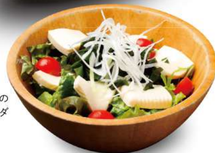
豆腐ワカメの 和風サラダ