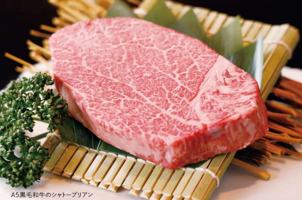
A5黒毛和牛のシャトーブリアン

※写真はイメージです Image is for illustration purposes / 图片仅供参考