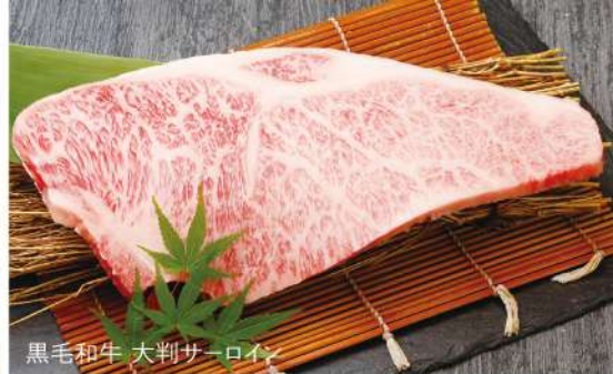
黒毛和牛 大判サーロイン

※写真はイメージです Image is for illustration purposes / 图片仅供参考