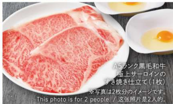
A5ランク黒毛和牛 極上サーロインの すき焼き仕立て(1枚)