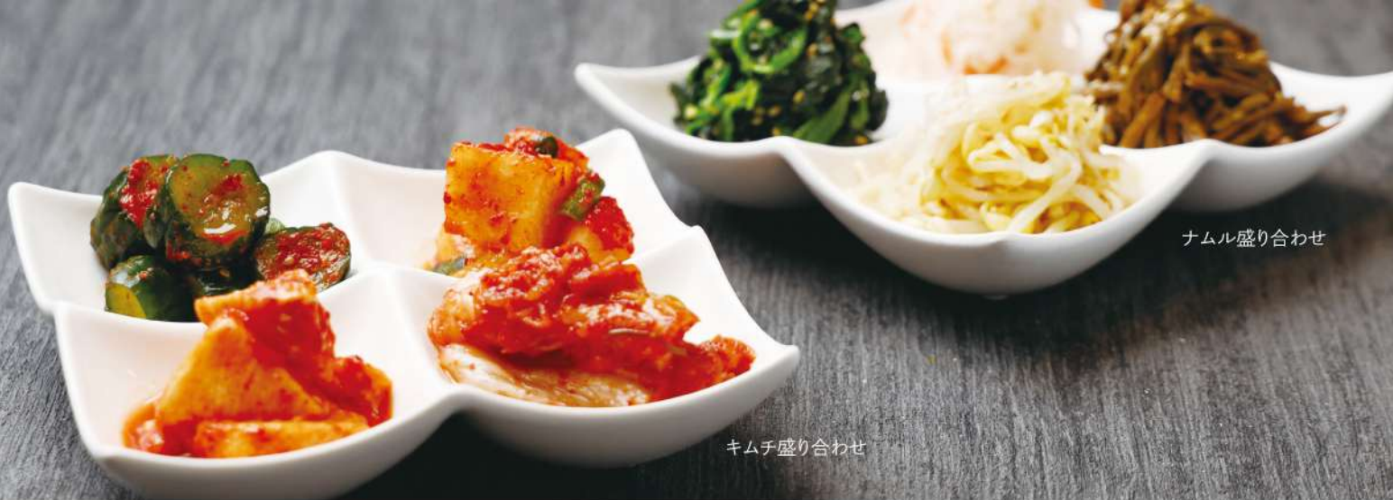
ナムル盛り合わせ