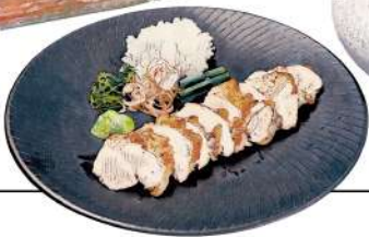
鶏たたき 刻み山葵と 鬼おろし ~低温仕上げ~