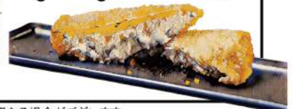
カニクリームコロッケ ~トリュフの薫り~