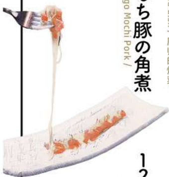
モzzarellaチーズ ベーコン巻き ~蜂蜜と黒コショウ~