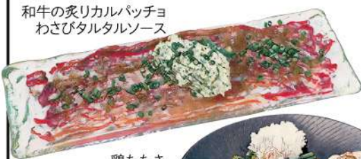
和牛の炙りカルパッチョ わさびタルタルソース