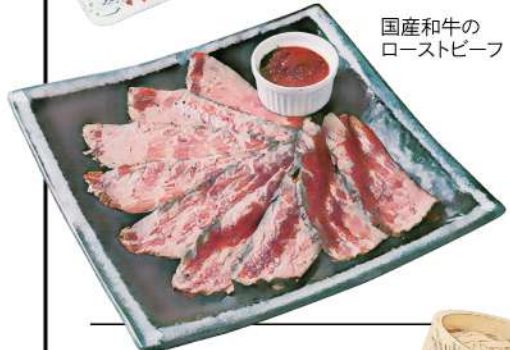
国産和牛のローストビーフ