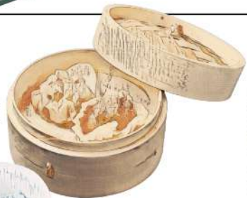
ほぼ生鶏レバーのユッケ風