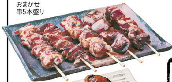
おまかせ 串5本盛り

"AKADORI" Chicken and Leek Skewer / 烤鸡肉大葱串