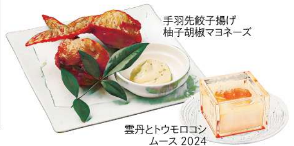
手羽先餃子揚げ 柚子胡椒マヨネーズ