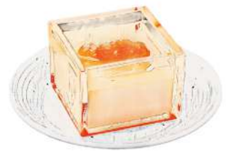
雲丹とトウモロコシムース 2024

雲丹とトウモロコシムース 2024 Sea urchin and corn mousse 2024 / 海胆玉米慕斯 2024 680