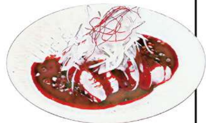
やみつき!よだれ鶏

焼き鳥屋の鶏焼売(2個) Chicken Siu Mai Dumplings / 鸡肉烧卖 420