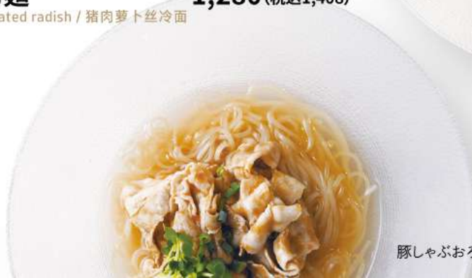
豚しゃぶおろし冷麺