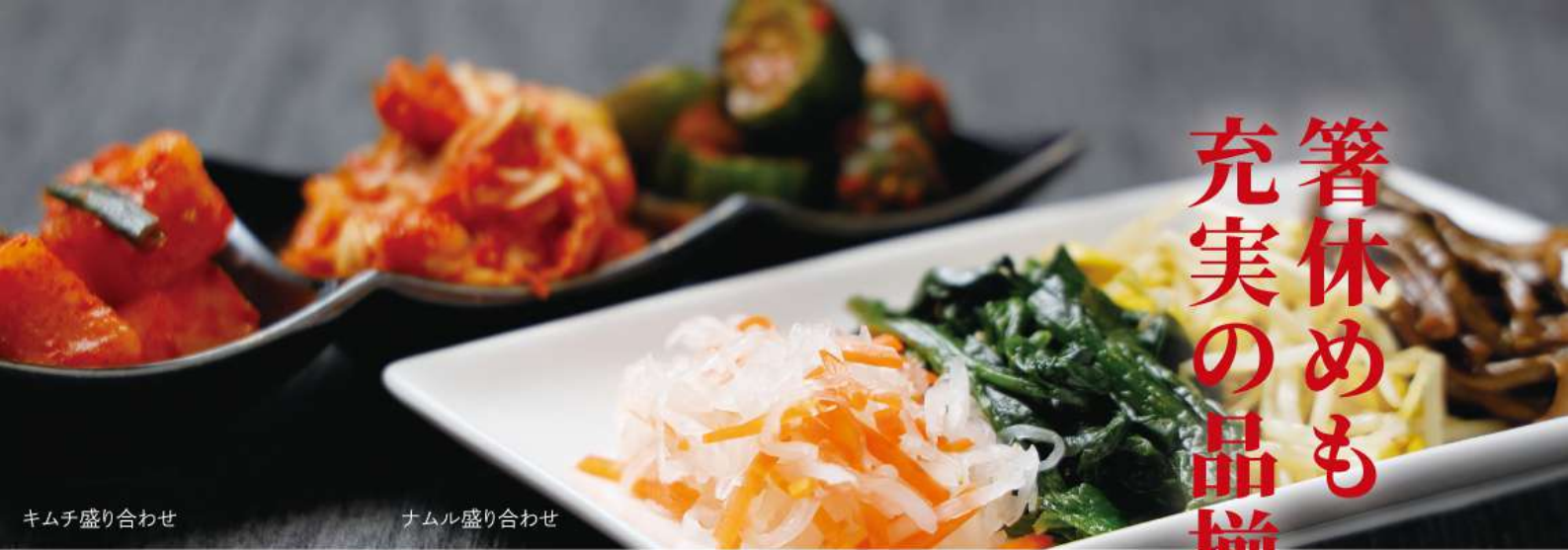
キムチ盛り合わせ