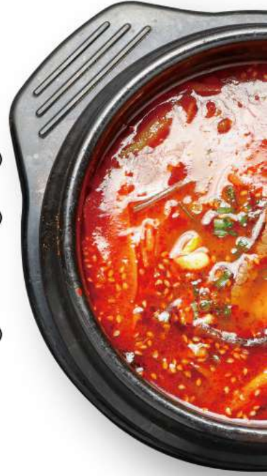
ユッケジャンクッパ