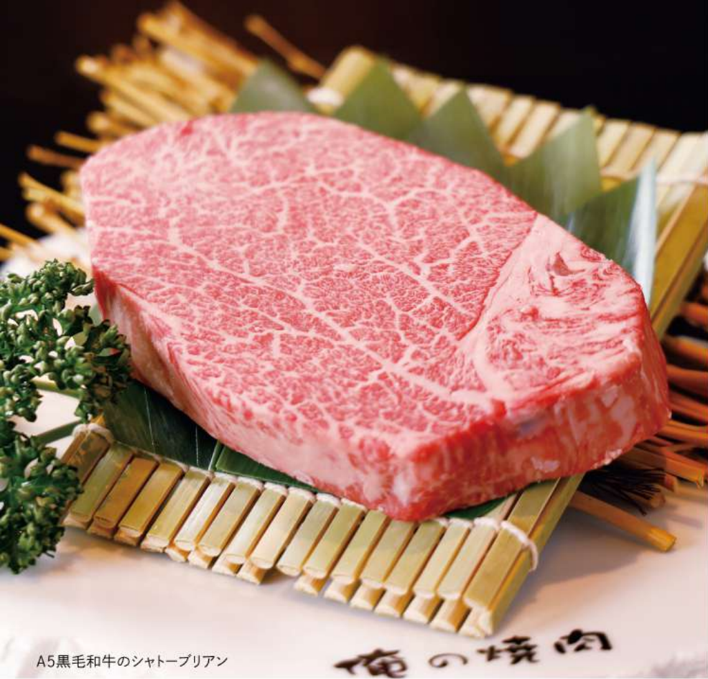
A5黒毛和牛のシャトーブリアン