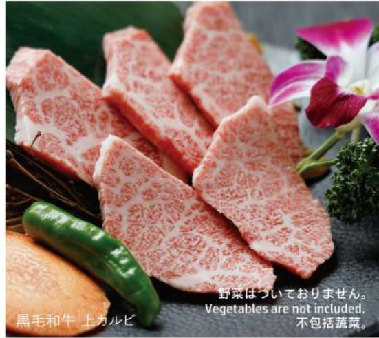
黒毛和牛 上カルビ

野菜はついておりません。 Vegetables are not included. 不包括蔬菜。