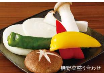
焼野菜盛り合わせ