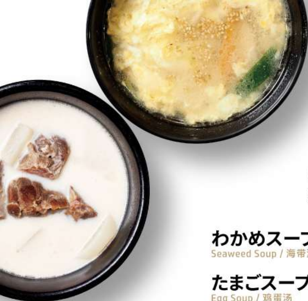
牛タン丸ごと!コムタンスープ