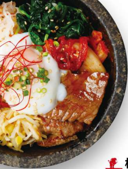
松阪牛石焼きビビンバ Hot Stone Bibimbap with Matsusaka beef 松阪牛石锅拌饭