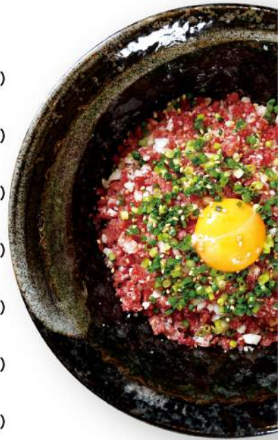
和牛ねぎとろご飯 Wagyu beef green onion rice 和牛葱饭