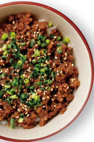
そぼろご飯 Seasoned minced beef over Steamed Rice 牛肉燥饭