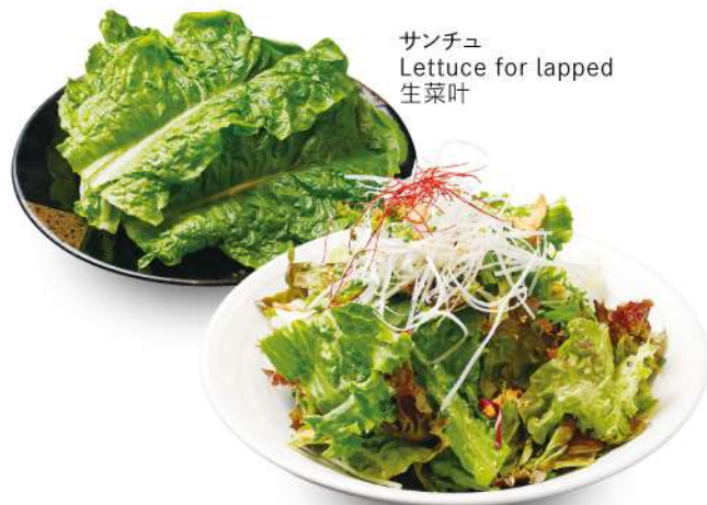
サンチュ Lettuce for lapped 生菜叶