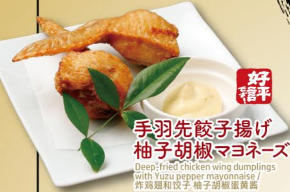
好 信 平 手羽先餃子揚げ 柚子胡椒マヨネーズ 680 Deep-fried chicken wing dumplings with Yuzu pepper mayonnaise / 炸鸡翅和饺子 柚子胡椒蛋黄酱