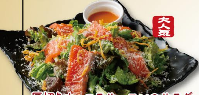
大人 厚切りオーロラサーモンのサラダ 玉葱と西京味噌ドレッシング 1,480 Thick-cut Aurora salmon salad with Onion and Saikyo miso dressing / 厚片极光三文鱼沙拉配洋葱和西京味噌酱