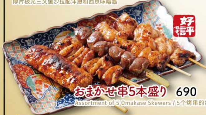
好 信 平 おまかせ串5本盛り 690 Assortment of 5 Omakase Skewers // 5个烤串的组合