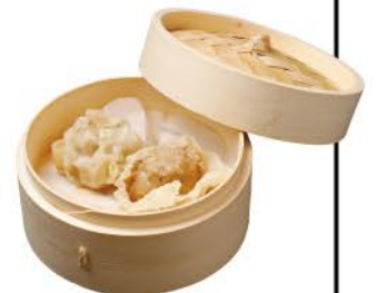
焼き鳥屋の鶏焼売(2個)