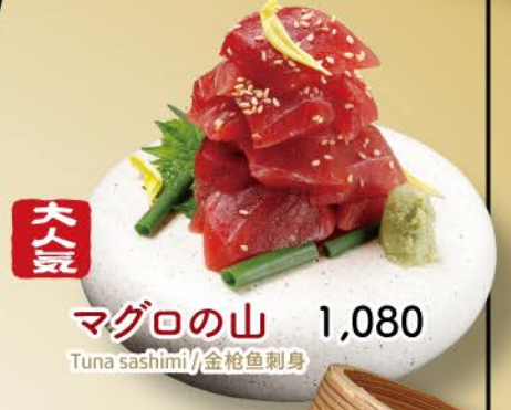
大人 マグロの山 1,080 Tuna sashimi / 金枪鱼刺身