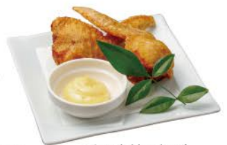
手羽先餃子揚げ 柚子胡椒マヨネーズ

厚切りオーロラサーモンのサラダ 1480 玉葱と西京味噌ドレッシング Thick-cut Aurora salmon salad with Onion and Saikyo miso dressing / 厚片极光三文鱼沙拉配洋葱和西京味噌酱