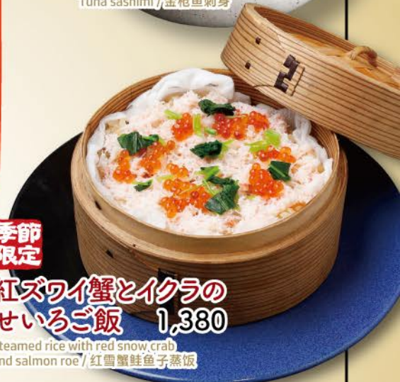
季節限定 紅ズワイ蟹とイクラの せいろご飯 1,380 Steamed rice with red snow crab and salmon roe / 红雪蟹鲑鱼子蒸饭