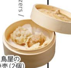
焼き鳥屋の 鶏焼売(2個)