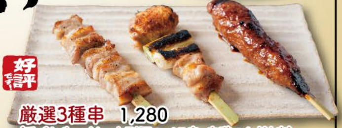
好 信 平 厳選3種串 1,280 (手ごね生つくね、山形豚のバラ串、赤鶏のねぎま串) Specially selected 3 kinds of skewers // 3种严选串烧组合

インスタでは 新作料理や 限定メニュー、 お得なイベント 情報など 随時配信中!