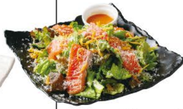
厚切りオーロラサーモンのサラダ 玉葱と西京味噌ドレッシング