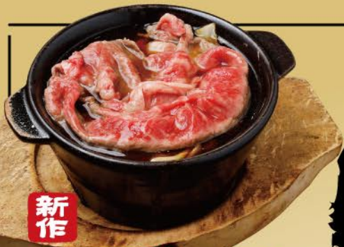
新作 和牛のすき鍋 1,280 WAGYU beef sukiyaki // 和牛寿喜鍋