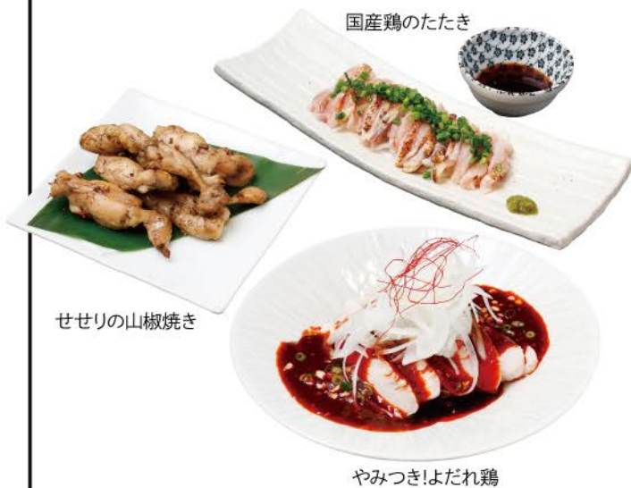
せせりの山椒焼き