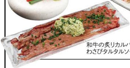
和牛の炙りカルパッチョ わさびタルタルソース