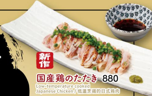
新作 国産鶏のたたき 880 Low-temperature cooked Japanese Chicken // 低温烹調の日式鸡肉