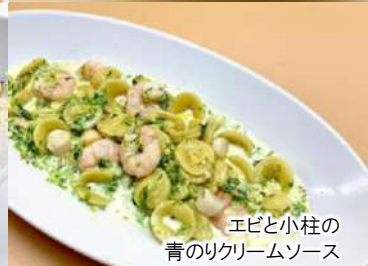
エビと小柱の 青のリクリームソース

ボンゴレビアンコ (スパゲティ) 990 Vongole Bianco (税込1,089)