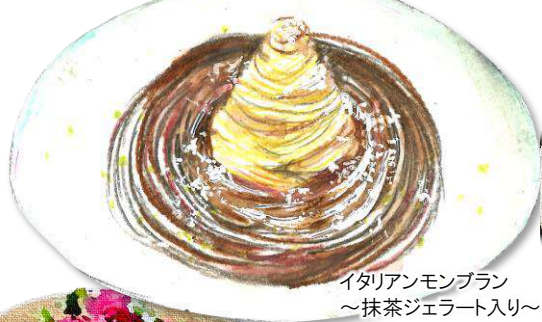
イタリアンモンブラン ～抹茶ジェラート入り～