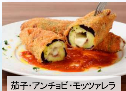
茄子・アンチョビ・モッツアレラ チーズの挟み揚げ 680 Fried eggplant, anchovies and mozzarella cheese (税込748)