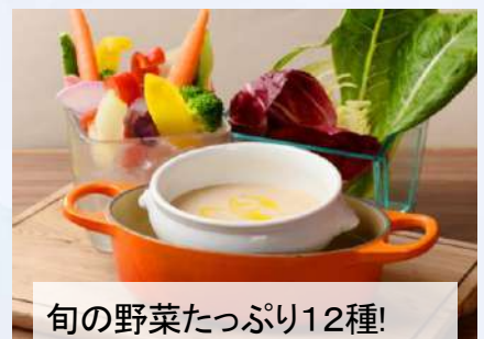
旬の野菜たっぷり12種! バーニャカウダ 1,180 12 kinds of Vegetables "Bagna cauda" (税込1,298)