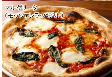
マルゲリータ (モzzarellaバジル)

ハラペーニョの辛いピザ 990 Spicy Jalapeno Pizza (税込1,089)