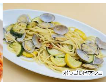
ボンゴレビアンコ

エビと小柱の 青のリクリームソース(オレキエッテ) 990 Aonori (dried green seaweed) cream sauce with Scallops and Shrimp. (税込1,089)