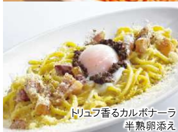
トリュフ香るカルボナーラ 半熟卵添え

エビと小柱の 青のリクリームソース(オレキエッテ) 990 Aonori (dried green seaweed) cream sauce with Scallops and Shrimp. (税込1,089)