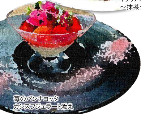
苺のパンナコッタ カシスジェラート添え