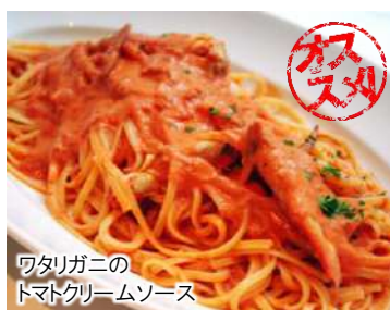
ワタリガニの トマトクリームソース

迷ったらコレ! ワタリガニのトマトクリームソース (スパゲッティ) 990 Tomato Cream Spaghetti with Gazami Crab (税込1,089)