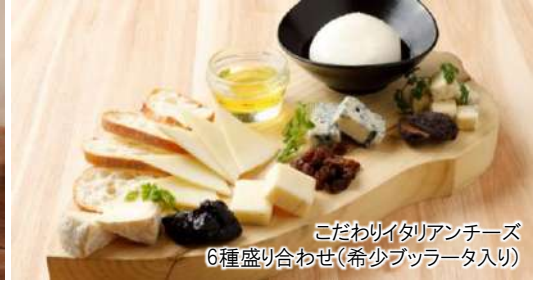
こだわりのイタリアンチーズ 6種盛り合わせ(希少ブッラータ入り)