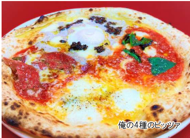
俺の4種のピッツァ

創業以来のベストセラー! トリュフとポルチーニのビスマルク 1,280 Special Bismarck (Truffle, Porcini, Eggs, Cheese) (税込1,408)