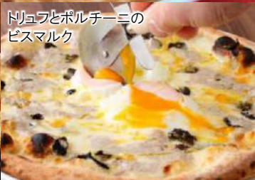
トリュフとポルチーニのビスマルク