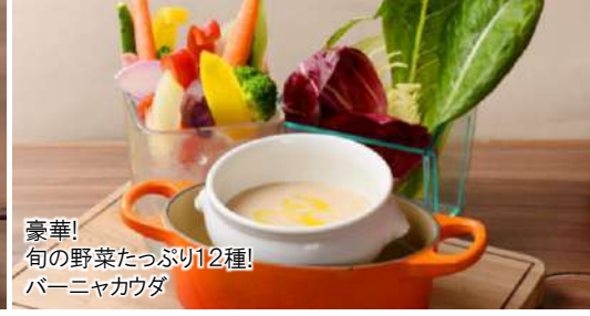
豪華! 旬の野菜たっぷり12種! バーニャカウダ