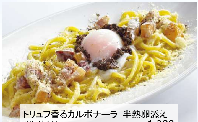
トリュフ香るカルボナーラ 半熟卵添え (リングイネ) 1,280 Carbonara with Truffle (税込1,408)