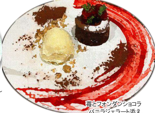
苺とフォンダンショコラ バニラジェラート添え