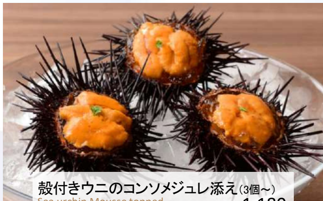
殻付きウニのコンソメジュレ添え(3個~) Sea urchin Mousse topped with Consomme Jelly 1,180 (税込1,298)