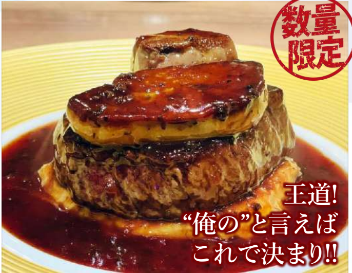
牛フィレ肉とフォアグラの 王道ロッシーニ 3,980 Beef fillet steak & Foie gras Rossini (税込4,378)