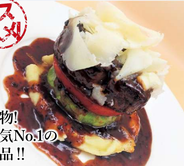
牛フィレ肉のトリコロレ トリュフソース 2,780 Tricolore with Truffle sauce (税込3,058) (Mille-feuille of Beef fillet steak, Ripe tomatoes, "KARUGA" eggplant)