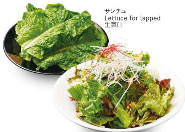
サンチュ Lettuce for lapped 生菜叶