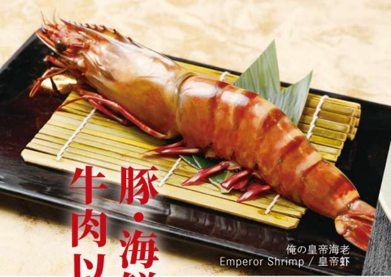
俺の皇帝海老 Emperor Shrimp / 皇帝虾