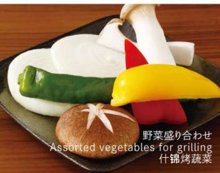
野菜盛り合わせ Assorted vegetables for grilling 什锦烤蔬菜