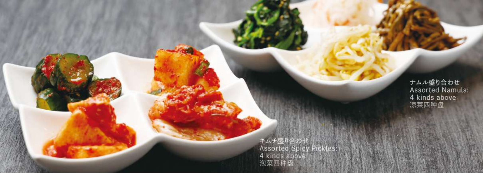
ナムル盛り合わせ Assorted Namuls: 4 kinds above 凉菜四种盘