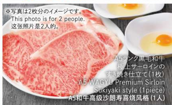
※写真は2枚分のイメージです。 This photo is for 2 people. 这张照片是2人的。