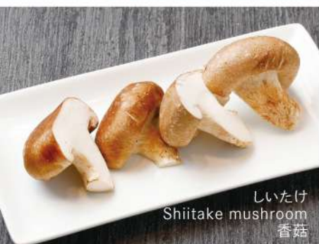
しいたけ Shiitake mushroom 香菇

※写真はイメージです Image is for illustration purposes / 图片仅供参考