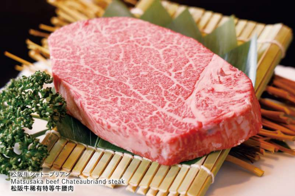
松阪牛シャトーブリアン Matsusaka beef Chateaubriand steak 松阪牛稀有特等牛腰肉

※写真はイメージです Image is for illustration purposes / 图片仅供参考