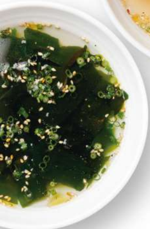
わかめスープ Seaweed Soup 海带汤