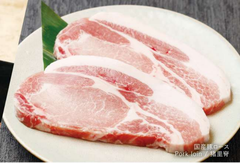
国産豚ロース Pork loin / 猪里脊