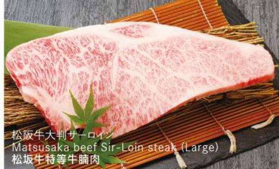
松阪牛大判サーロイン Matsusaka beef Sir-Loin steak (Large) 松阪牛特等牛腩肉

※写真はイメージです Image is for illustration purposes / 图片仅供参考