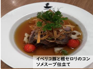
イベリコ豚と根セロリのコン ソメスープ仕立て

イベリコ豚と根セロリのコンソメスープ仕立て Iberico pork and celery root consommé soup style