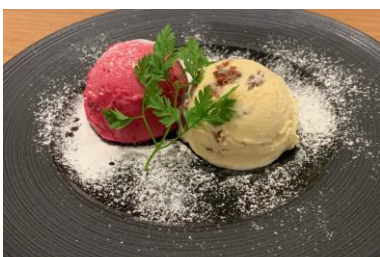
本日のジェラート2種盛り合わせ