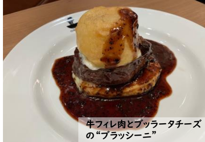
牛フィレ肉とブッラータチーズ の“ブラッシーニ”

“Rossni” Rosted Beef Fillet and Foie Gras