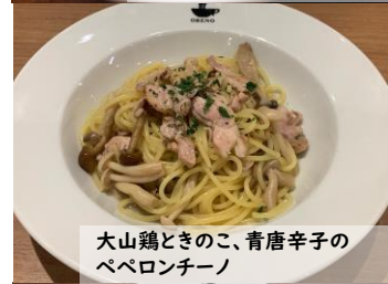
大山鶏ときのこと、青唐辛子の ペペロンチーノ