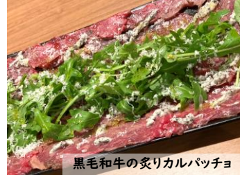
黒毛和牛の炙りカルパッチョ