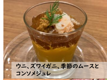
ウニ、ズワイガニ、季節のムースとコンソメジュレ