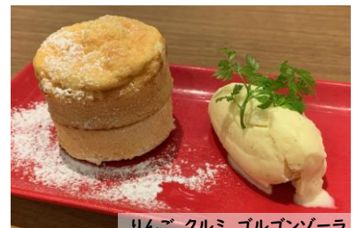
りんご、クルミ、ゴルゴンゾーラ の温かいチーズケーキ