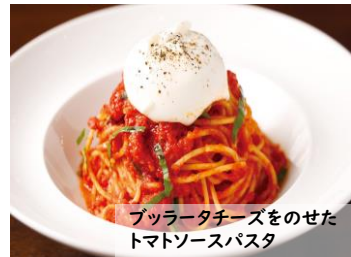
ブルラータチーズをのせた トマトソースパスタ