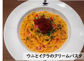
ウニとイクラのクリームパスタ