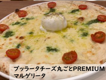
ブルラータチーズ丸ごとPREMIUM マルゲリータ

トリュフとキノコソース、半熟卵のビスマルク おすすめ Bismarck(Truffle and Porcini sauce)