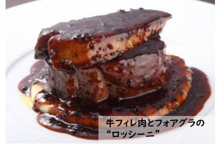
牛フィレ肉とフォアグラの “ロッシーニ”