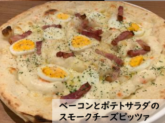
ベーコンとポテトサラダの スモークチーズピッツァ