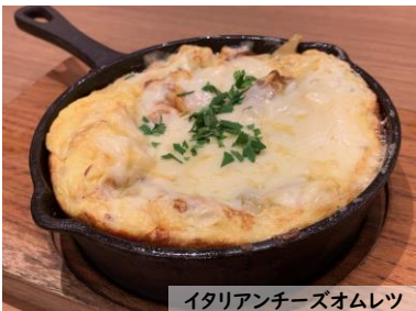
イタリアンチーズオムレツ