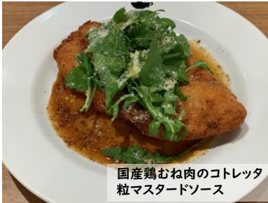
国産鶏むね肉のコトレッタ 粒マスタードソース

国産鶏むね肉のコトレッタ 粒マスタードソース Domestic chicken cotoletta with grain mustard sauce