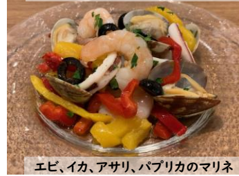
エビ、イカ、アサリ、パプリカのマリネ