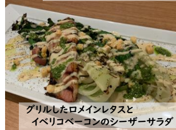
グリルしたロメインレタスとイベリコベーコンのシーザーサラダ