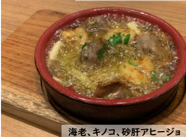
海老、キノコ、砂肝アヒージョ