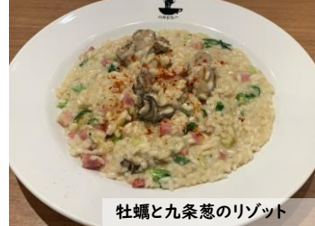
牡蠣と九条葱のリゾット