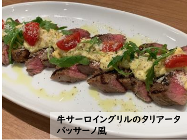
牛サーロイングリルのタリアータ バッサーノ風

牛サーロイングリルのタリアータ バッサーノ風 Grilled beef sirloin tagliata Bassano style