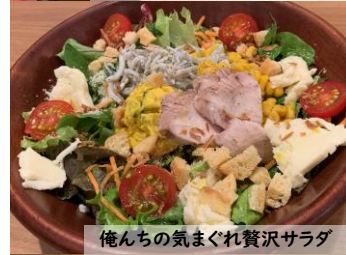
俺んちの気まぐれ贅沢サラダ