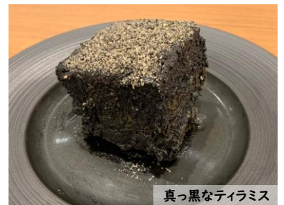
真っ黒なティラミス