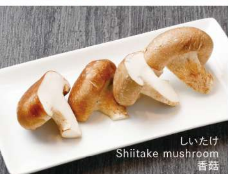
しいたけ Shiitake mushroom 香菇

※写真はイメージです Image is for illustration purposes / 图片仅供参考