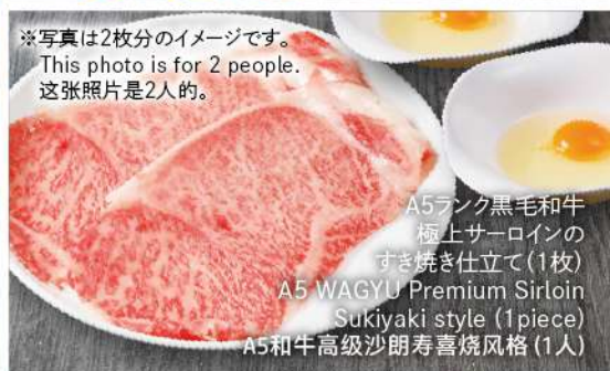
※写真は2枚分のイメージです。 This photo is for 2 people. 这张照片是2人的。