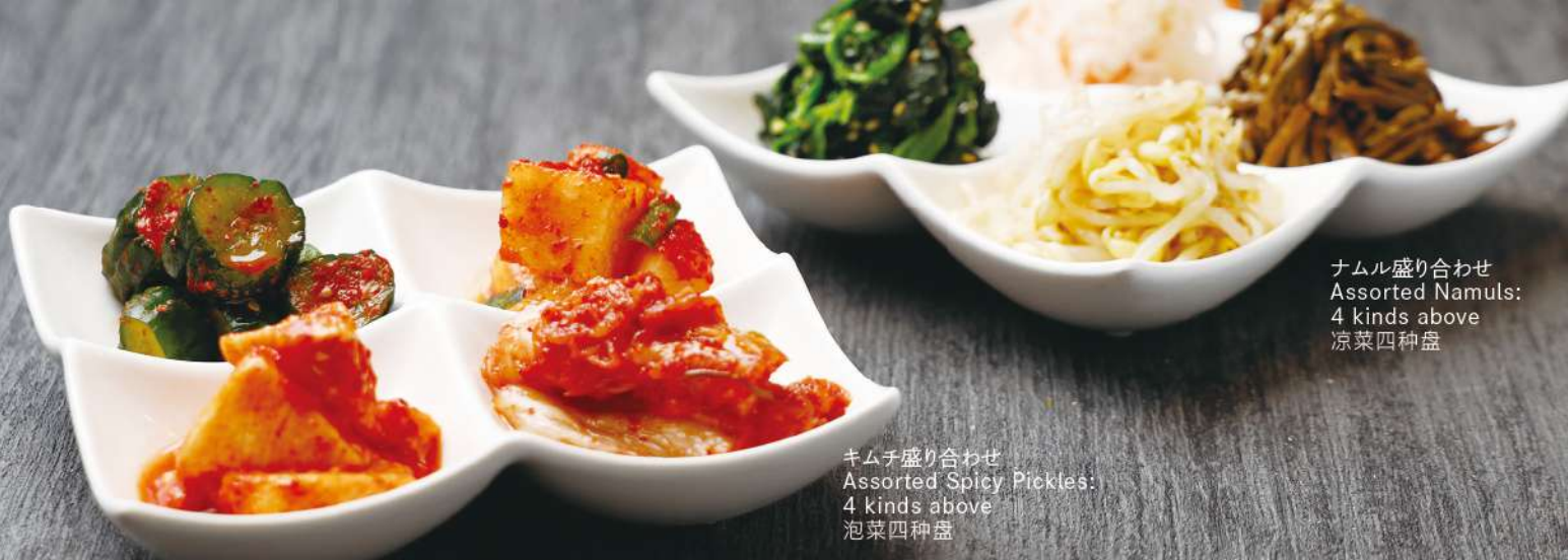
ナムル盛り合わせ Assorted Namuls: 4 kinds above 凉菜四种盘