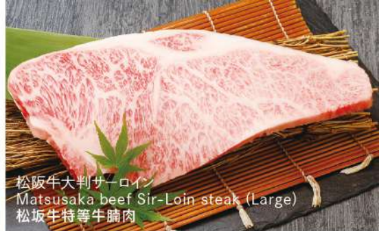
松阪牛大判サーロイン Matsusaka beef Sir-Loin steak (Large) 松坂牛特等牛腩肉