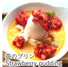
苺のプリン Strawberry pudding