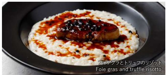
フォアグラとトリュフのリゾット Foie gras and truffle risotto