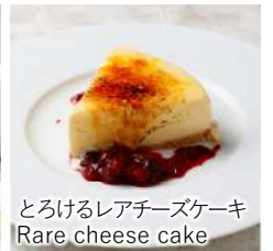
とろけるレアチーズケーキ Rare cheese cake