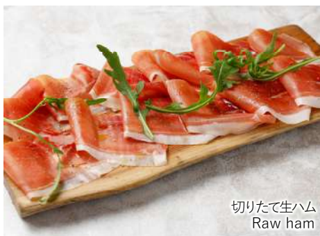
切りたて生ハム Raw ham