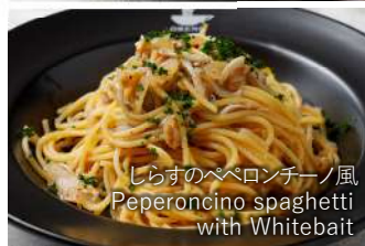
しらすのペペロンチーノ風 Peperoncino spaghetti with Whitebait