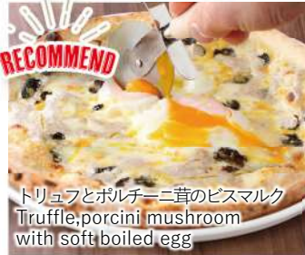
トリュフとポルチーニ茸のビスマルク Truffle, porcini mushroom with soft boiled egg