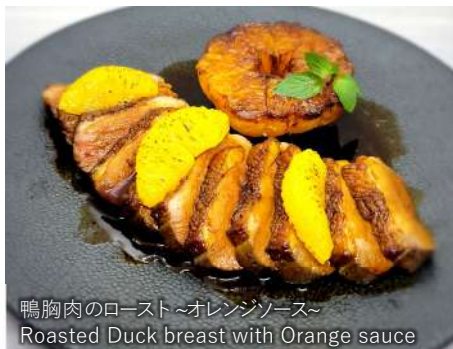
鴨胸肉のロースト～オレンジソース～ Roasted Duck breast with Orange sauce