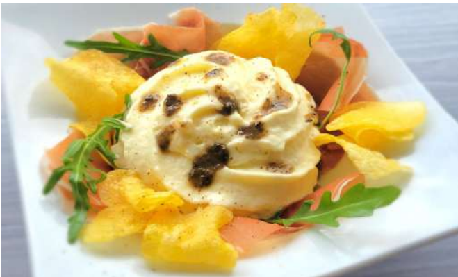
エスプーマのポテトサラダ チップス添え