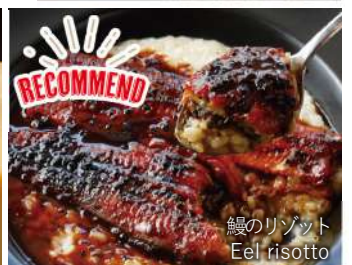
鰻のリゾット Eel risotto

リゾット大盛り large serving of Risotto +500(税込550)