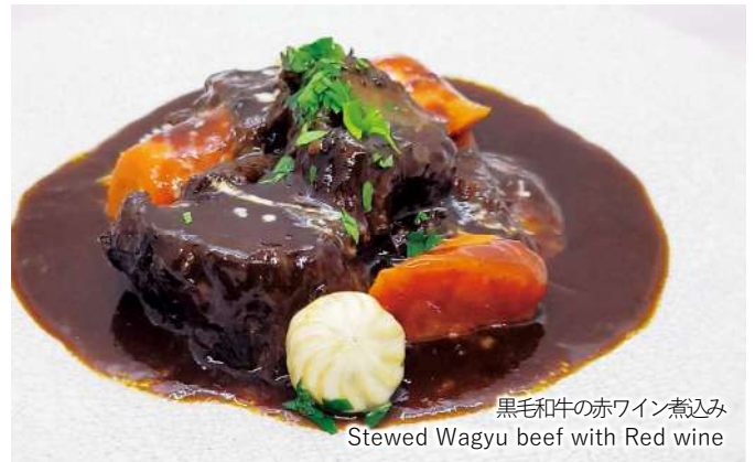
黒毛和牛の赤ワイン煮込み Stewed Wagyu beef with Red wine