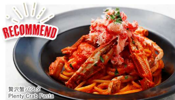
贅沢蟹パスタ Plenty Crab Pasta