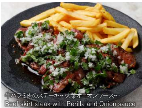
牛ハラミ肉のステーキ～大葉オニオンソース～ Beef skirt steak with Perilla and Onion sauce