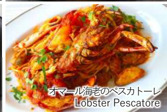
オマール海老のペスカトーレ Lobster Pescatore

パスタ大盛り large serving of pasta +300(税込330)