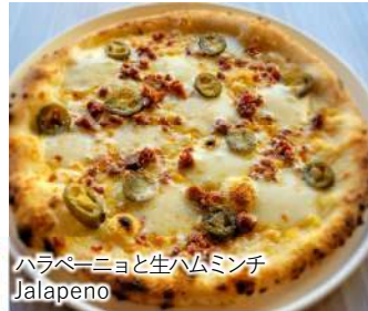
ハラペーニョと生ハムミンチ Jalapeno