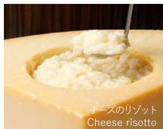
チーズのリゾット Cheese risotto