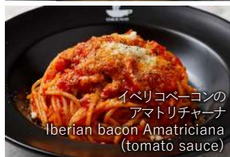
イベリコベーコンの アマトリチャーナ Iberian bacon Amatriciana (tomato sauce)