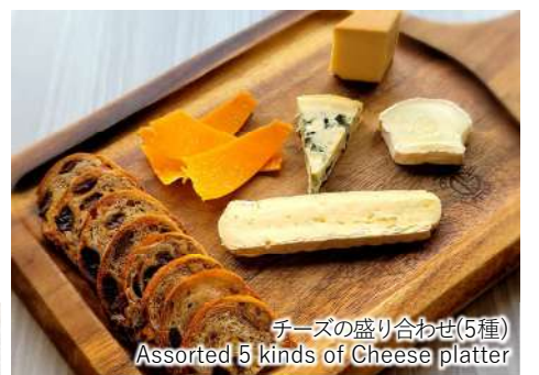
チーズの盛り合わせ(5種) Assorted 5 kinds of Cheese platter