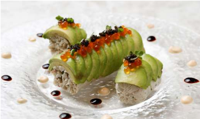
アボカドをまとったタラバ蟹 キャビアとイクラ

King crab wrapped in avocado with Caviar and salmon roe