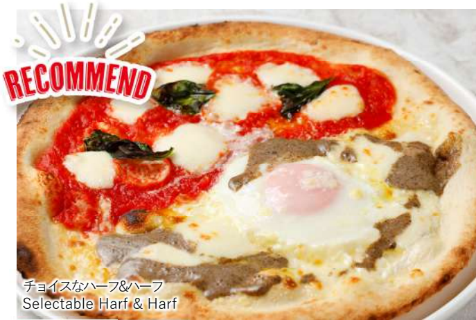
チョイスなハーフ&ハーフ Selectable Harf & Harf