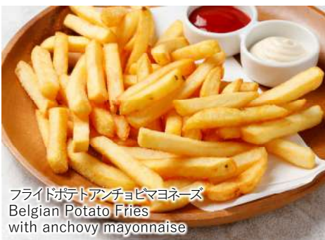
フライドポテトアンチョビマヨネーズ Belgian Potato Fries with anchovy mayonnaise