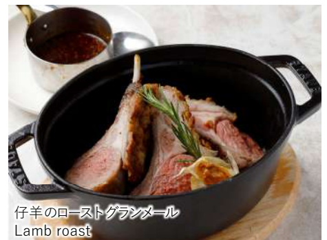
仔羊のローストグランメール Lamb roast