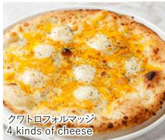
クワトロフォルマッジ 4 kinds of Cheese