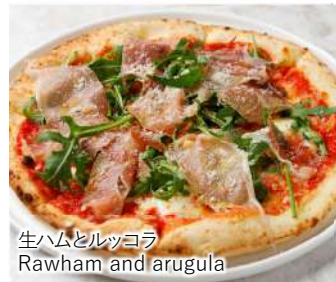
生ハムとルッコラ Rawham and arugula