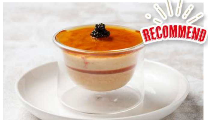
ズワイ蟹とカリフラワーのムース キャビア添え~プリンセスM~

Snow crab flan and cauliflower mousse with caviar