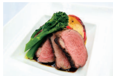
マグレ鴨のロースト