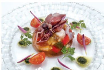
富山県産ホタルイカのスモークと 季節野菜のアスピック