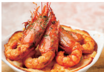
赤海老のグラタン