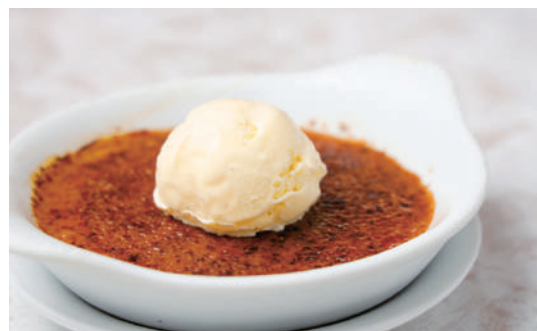
神楽坂クレームブリュレ