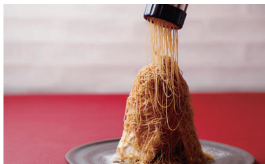
特製!!生搾りモンブラン