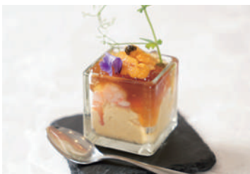
雲丹、海老、帆立、オマールの コンソメジュレと季節野菜のフォンダン