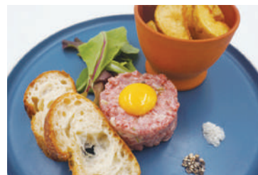
北海道産牛肉のタルタル