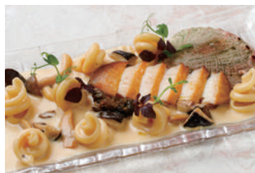
丸ごと1ヶ! 鮑のソテー

フォアグラのリゾット～黒トリュフソース～ (フォアグラ80g) Risotto with Sauteed Foie Gras with Black Truffle sauce (Foie gras 80g) 2,480(税込2,728)