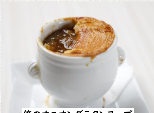
俺のオニオングラタンスープ

Potato Salad with Truffle flavor 480(税込528)