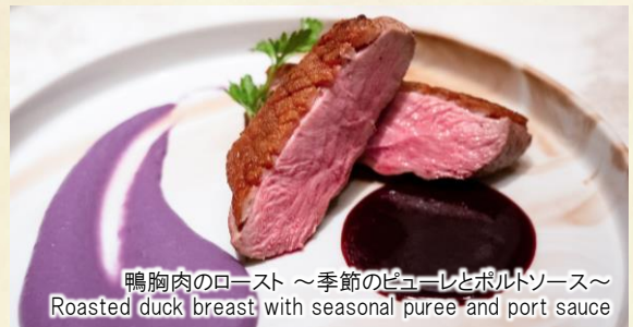
鴨胸肉のロースト～季節のピューレとポルトソース～ Roasted duck breast with seasonal puree and port sauce