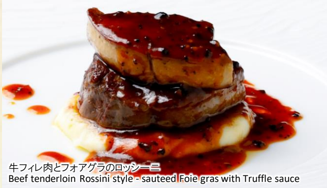
牛フィレ肉とフォアグラのロッシーニ Beef tenderloin Rossini style - sauteed Foie gras with Truffle sauce