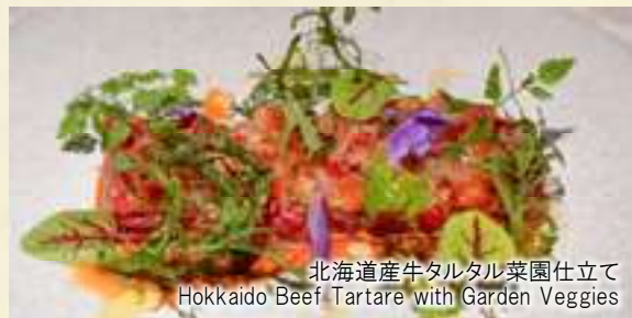
北海道産牛タルタル菜園仕立て Hokkaido Beef Tartare with Garden Veggies