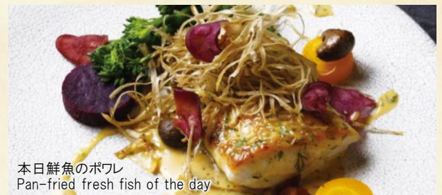
本日鮮魚のポワレ Pan-fried fresh fish of the day