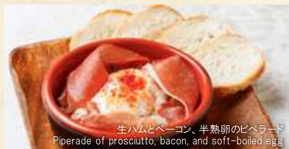
生ハムとベーコン、半熟卵のピペラード Piperade of prosciutto, bacon, and soft-boiled egg