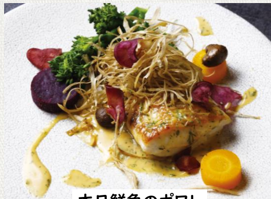
本日鮮魚のポワレ

Pan-fried fresh fish of the day 1,780(税込1,958)