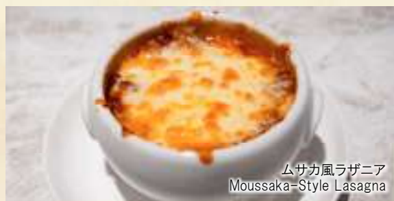
ムサカ風ラザニア Moussaka-Style Lasagna