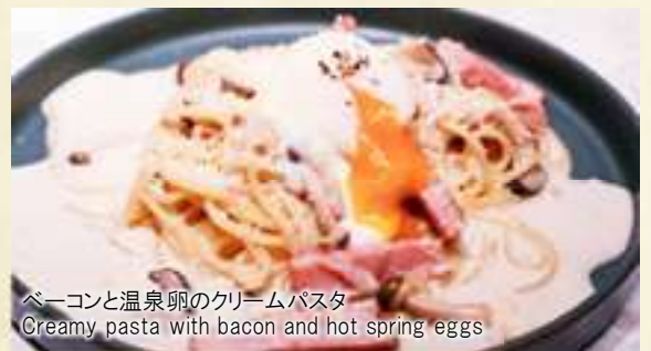
ベーコンと温泉卵のクリームパスタ Creamy pasta with bacon and hot spring eggs