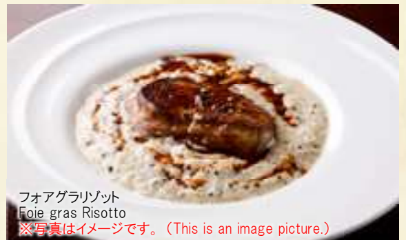
フォアグラリゾット Foie gras Risotto ※写真はイメージです。(This is an image picture.)