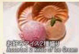
お好みアイス2種盛り Assorted 2 kinds of Ice Cream