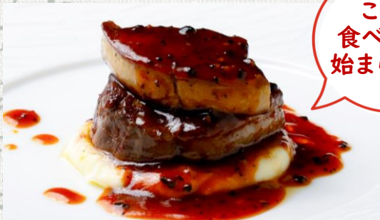
牛フィレ肉とフォアグラのロッシーニ (牛フィレ150g+フォアグラ50g)

Beef tenderloin Rossini style - sauteed Foie gras with Truffle sauce 3,480(税込3,828)