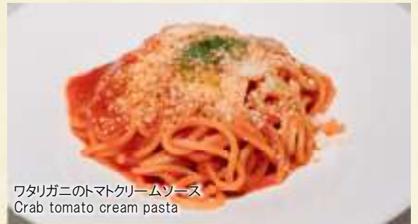
ワタリガニのトマトクリームソース Crab tomato cream pasta