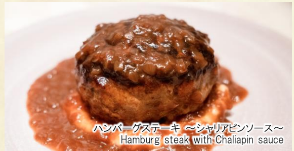
ハンバーグステーキ～シャリアピンソース～ Hamburg steak with Chaliapin sauce