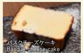
バスクチーズケーキ Basque cheese cake