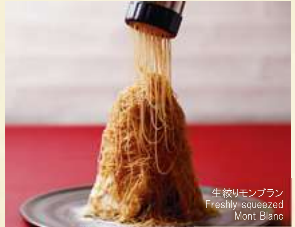
生搾りモンブラン Freshly squeezed Mont Blanc