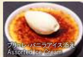
ブリュレ・バニラアイス添え Assorted Ice Cream