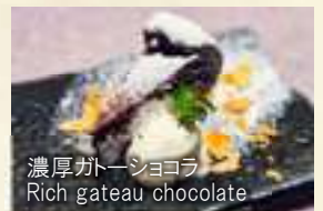
濃厚ガトーショコラ Rich gateau chocolate