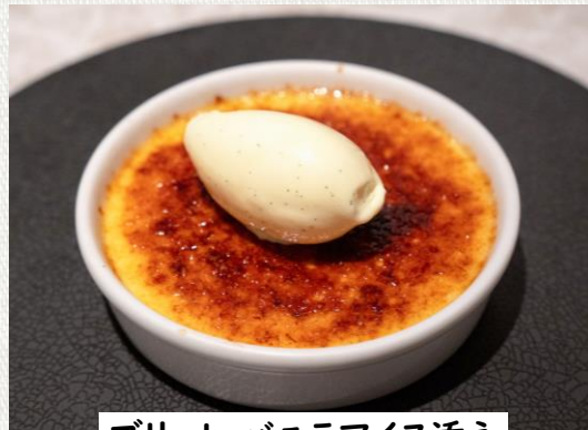
ブリュレ バニラアイス添え

Pan-fried fresh fish of the day 1,780(税込1,958)