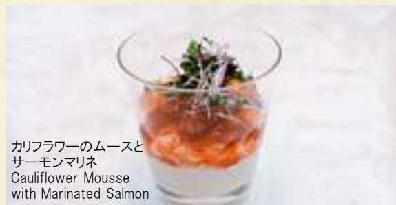
カリフラワーのムースと サーモンマリネ Cauliflower Mousse with Marinated Salmon