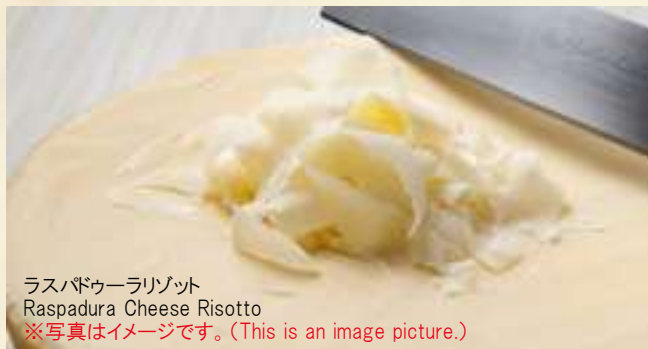
ラスパドゥーラリゾット Raspadura Cheese Risotto ※写真はイメージです。(This is an image picture.)