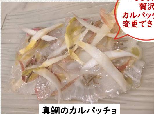
真鯛のカルパッチョ