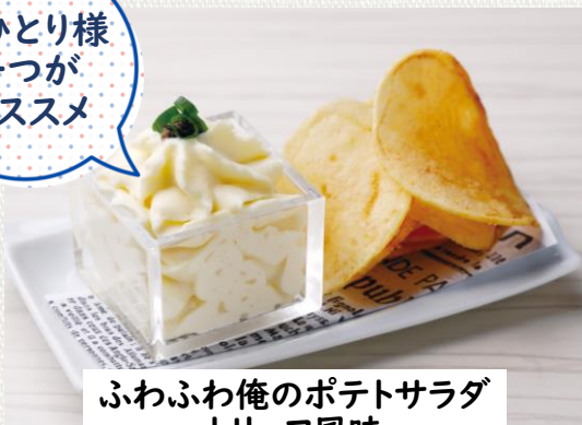
ふわふわ俺のポテトサラダ ~トリュフ風味~

Potato Salad with Truffle flavor 480(税込528)